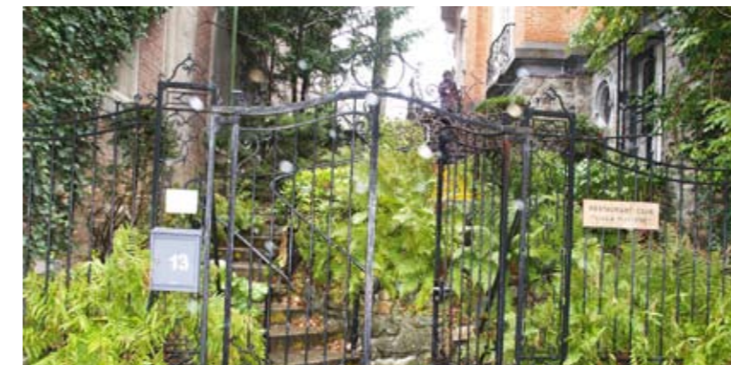
La villa Mathine, un écrin qui embellit le quotidien

La Commune d’Ixelles met à votre disposition cinq restaurants communaux, appelés plus communément “Resto-Clubs”. En tant qu’Ixellois, vous pouvez y aller tous les midis, du lundi au vendredi, de 11h30 à 13h30. Le tarif du repas ou de menu proposé est calculé sur base du niveau de vos revenus (Renseignements au Service Social de la Commune au 02/515 60 59).