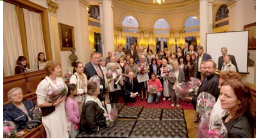
Les élus du concours à la remise de prix dans la salle du conseil communal.

J'y travaille un peu tous les jours... et puis il faut arroser. En été, ça me prend minimum deux heures par jour. Auparavant, un locataire pensionné venait m'aider, mais il est mort. Maintenant, je suis aidée à l'occasion par le jardinier du Foyer Ixellois. En ce qui concerne le coût, c'est sûr que c'est un